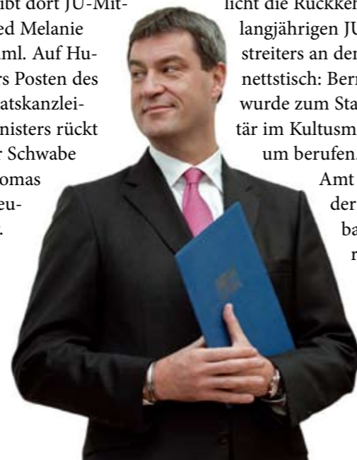
Bayerns neuer Schatzmeister: Markus Söder

Die Rochade im bayerischen Ministerrat ermöglicht die Rückkehr eines langjährigen JU-Mitstreiters an den Kabinetttisch: Bernd Sibler wurde zum Staatssekretär im Kultusministerium berufen. Dieses Amt hatte der Niederbayer bereits von 2007 bis 2008 ausgeübt.